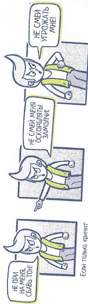
Если только кричат

(кричать, оскорблять и т. д. — по контексту)